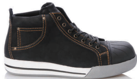
KURT » 8B12.24 (S3)