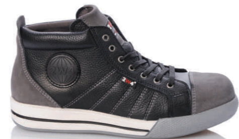
PARKER » 8B30.00 (S3)