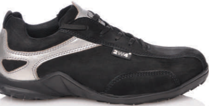
ANNA » REF. 8A85.20 S3