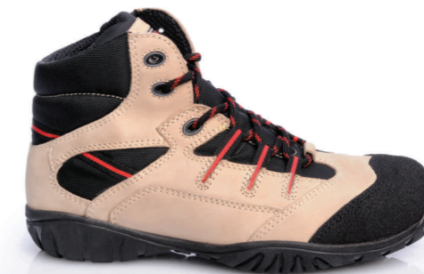
NEBRASKA » REF. 8B08.24 (S3)