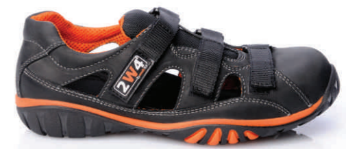
MIAMI » REF. 8A44.20 (S1P)