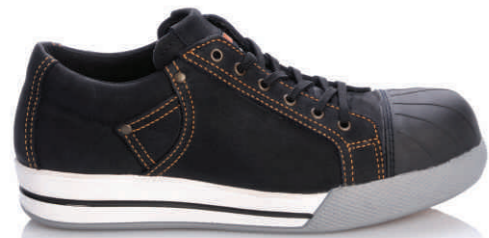
BRAD » 8A12.24 (S3)