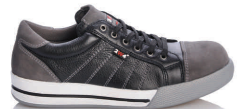
RYAN » 8A30.00 (S3)