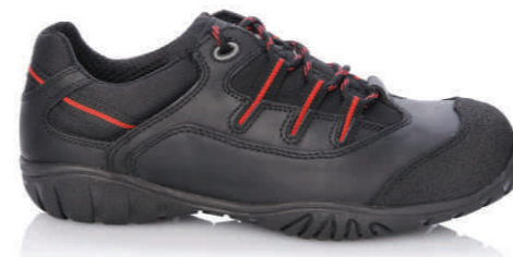
TEXAS » REF. 8A08.20 (S3)