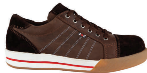
PETER » 8A30.63 (S3)