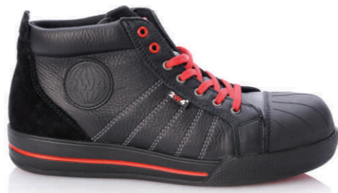
DEXTER » 8B30.10 (S3)