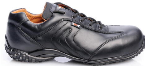
MILANO » REF. 8A38.60 S3