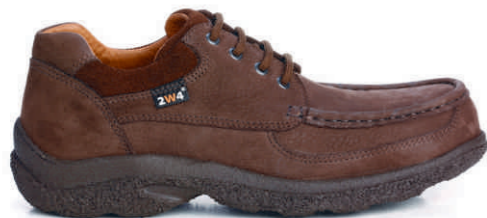
VIGO » REF. 8A14.22 S3