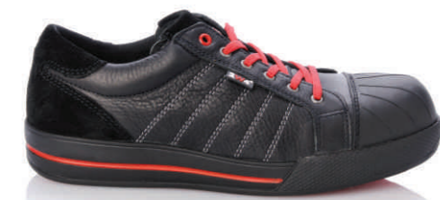
CHUCK » 8A30.10 (S3)