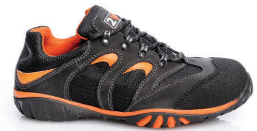
SIDNEY » REF. 8A09.20 (S1P)