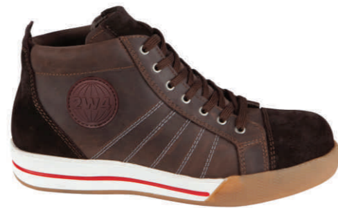
MIKE » 8B30.63 (S3)