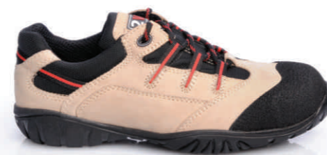
CHICAGO » REF. 8A08.24 (S3)