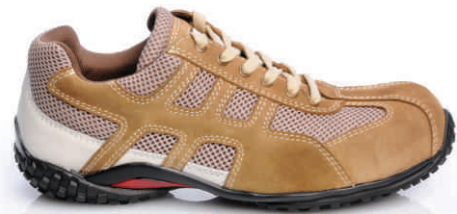
VERONA » REF. 8A78.14 S1P