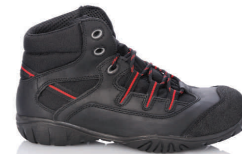
NEW YORK » REF. 8B08.20 (S3)